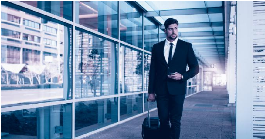
A1-Bescheinigung dabei? Sie ist für alle Aktivitäten im Ausland nötig.

entrichten hat. Es ist für sämtliche grenzüberschreitenden Tätigkeiten nötig, beispielsweise für Berater, Künstler, Journalisten oder Mitarbeiter im Transport oder Baugewerbe, und zwar auch dann, wenn der Aufenthalt nur wenige Stunden beträgt. Ausgestellt wird die A1-Bescheinigung von der AHV-Ausgleichskasse im Wohnsitzland des betroffenen Arbeitnehmers, beantragt wird sie vom Arbeitgeber des Entsandten bzw. direkt vom Selbständigerwerbenden.