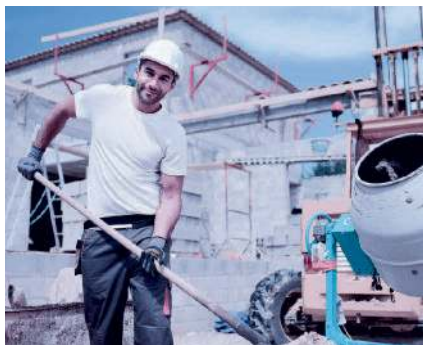
Zu den meldepflichtigen Berufsarten gehören neu alle Tätigkeiten für Hilfsarbeitskräfte, mit Ausnahme von Reinigungspersonal.

Liste der meldepflichtigen Berufsarten 2020: www.arbeit.swiss > Arbeitgeber > Stellenmeldepflicht