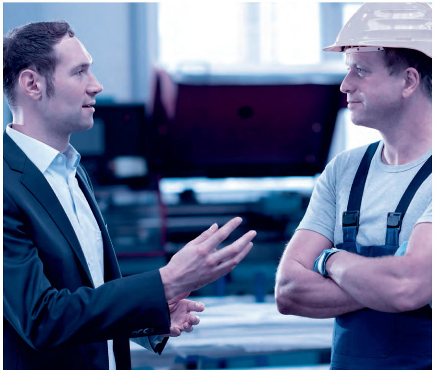
Das Mitarbeitergespräch ist keine Nebensache. Nehmen Sie sich Zeit und hören Sie zu.

Sinnvollerweise wird für das Mitarbeitergespräch zudem ein über die Jahre gleichbleibender Beurteilungsbogen mit einer Bewertungsskala (mit Smileys, Ampeln, Zahlen oder Buchstaben) verwendet.